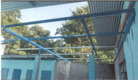
FOTO 7: Sustrucción de lámina, por lámina troquelada aluzinc calibre 26