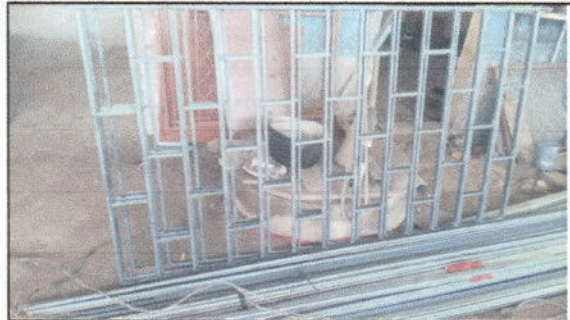
FOTO 8: Fabricación e instalación de balcones de hierro en ventana